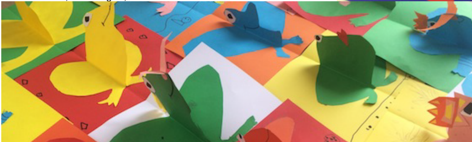
Grenouilles réalisées par des enfants (d'environ 5 ans)