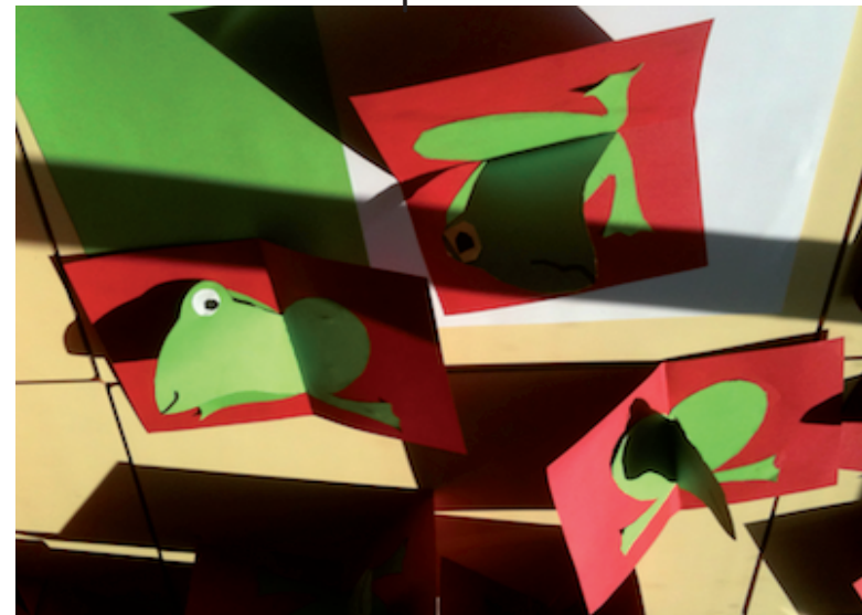
Grenouilles réalisées par des enfants (d'environ 5 ans)